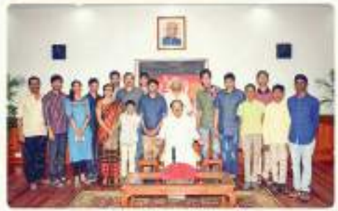
2:16 PM · 13 Oct 18

VicePresidentOfIndia @vpofindia One should remember 5 things in their life: Mother, Native Place, Mother tongue, Motherland and Teacher. You should have discipline in your life and have commitment on your work. Aim high, dream high and work hard for achieving it. @Rashtrottihara_P @RashtrottiharaParishad