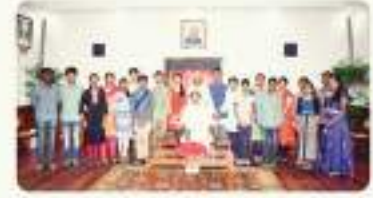
2:11 PM · 13 Oct 18

VicePresidentOfIndia @vpofindia Always follow our traditions, festivals, culture. You should celebrate all festivals. Be faithful to your nation; be faithful to your work. Follow Swachh Bharat! Religion is a way of worship. Culture is a way of living. Share and Care is core of our philosophy. @Rashtrottihara_P