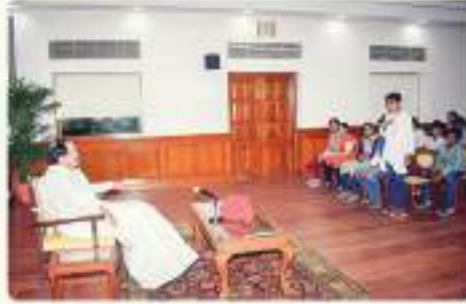
2:11 PM · 13 Oct 18

VicePresidentOfIndia @vpofindia Delighted to meet & interact with Students of @RashtrottiharaParishad, a Social Organization from Karnataka, in New Delhi today. I am glad to know the organization is working with an aim to spread cultural awareness through social service & mass education. @Rashtrottihara_P