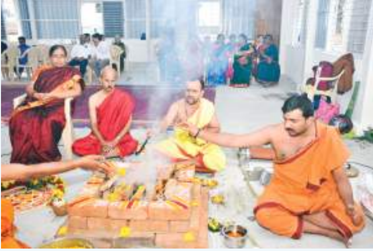
ಗಾಯತ್ರಿ ನಗರದಲ್ಲಿ ನಡೆದ ನೂತನ ಯೋಗಕೇಂದ್ರದ ಲೋಕಾರ್ಪಣಾ ಕಾರ್ಯಕ್ರಮ